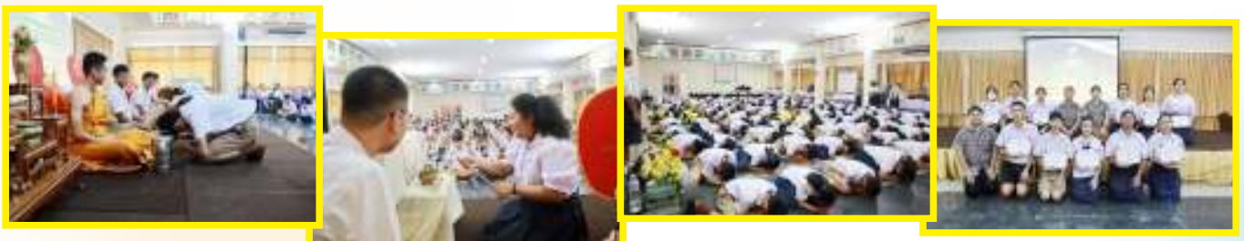
กิจกรรมส่งเสริมจริยธรรมและมารยาทไทย ประจำปีการศึกษา 2567 วันที่ 28 มิถุนายน 2567