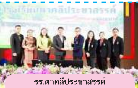
รร.ตาคลีประชาสรรค์ จ.นครศรีธรรมราช