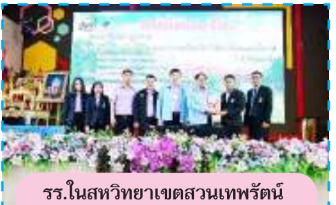
รร.โนนสีวิทยาเขตสวนเทพรัตน์ ที่ปไต้เฉลิมพระเกียรติ จ.ปทุมธานี