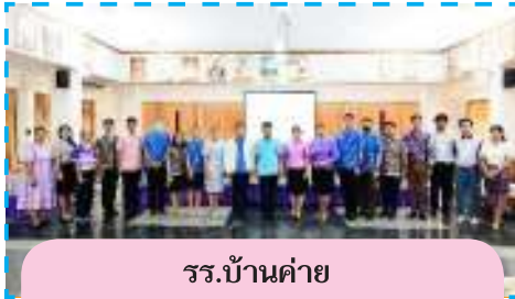
รร.บ้านค่าย จ.ระยอง