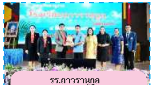
รร.ถาวรานุกุล จ.สมุทรสงคราม