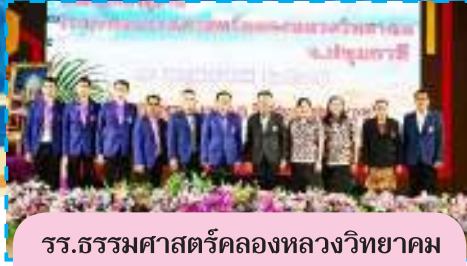
รร.ธรรมศาสตร์คลองหลวงวิทยา จ.ปทุมธานี