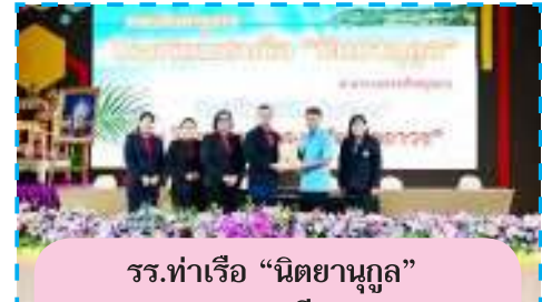
รร.ท่าเรือ "นิตยานุกูล" จ.พระนครศรีอยุธยา