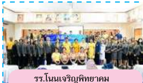
รร.โนนเจริญพิทยาคม จ.บุรีรัมย์