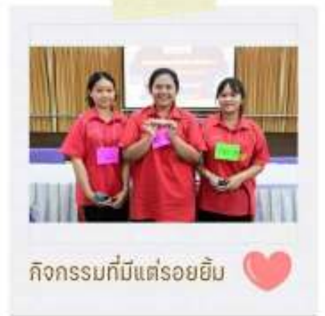
กิจกรรมที่มีแต่รอยยิ้ม

นักเรียนเพื่อนที่ปรึกษา YC เป็นการสร้างให้เยาวชนมีความรู้ความสามารถในการให้คำปรึกษากับเพื่อนนักเรียน เนื่องจากเด็กในช่วงวัยเดียวกัน จะมีความเข้าใจและไว้วางใจกันมากกว่า หากนักเรียนได้รับการพัฒนาการให้คำปรึกษาเบื้องต้นอย่างถูกต้องและสามารถนำทักษะการให้คำปรึกษาไปใช้ประโยชน์ ช่วยเหลือเพื่อนนักเรียนได้และสามารถสร้างแกนนำเพื่อนที่ปรึกษากายในโรงเรียน ซึ่งจะเป็นกำลังสำคัญในการเสริมสร้างความเข้มแข็งในระบบดูแลช่วยเหลือนักเรียน