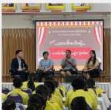
เสวนาแลกเปลี่ยนเรียนรู้ มีจิตร์รุ่นพี่...สู่ YC รุ่นน้อง