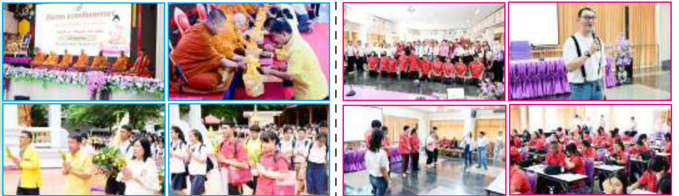
กิจกรรมทำบุญถวายเทียนพรรษาและเวียนเทียน เนื่องในวันอาสาฬหบูชาและวันเข้าพรรษา วันที่ 19 กรกฎาคม 2567