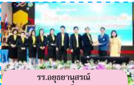
รร.อูยยานุสรณ์ จ.พระนครศรีอยุธยา