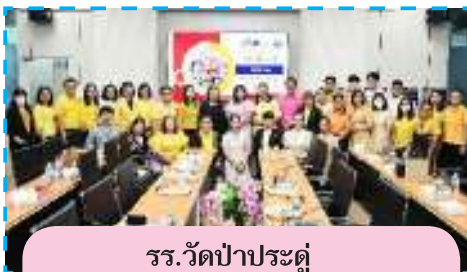
รร.วัดป่าประดู่ จ.ระยอง