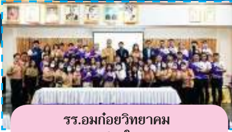
รร.อมก๋อยวิทยา จ.เชียงใหม่