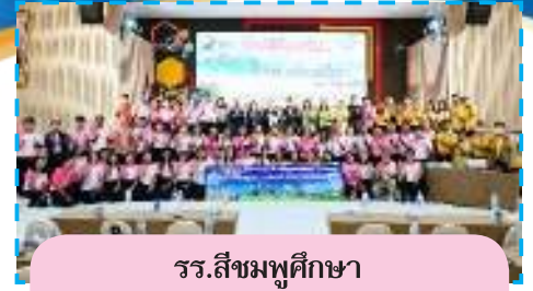
รร.สยามศึกษา จ.ขอนแก่น