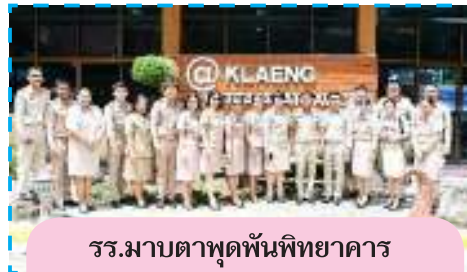
รร.มาบตาพุดพันพิทยาคาร จ.ระยอง