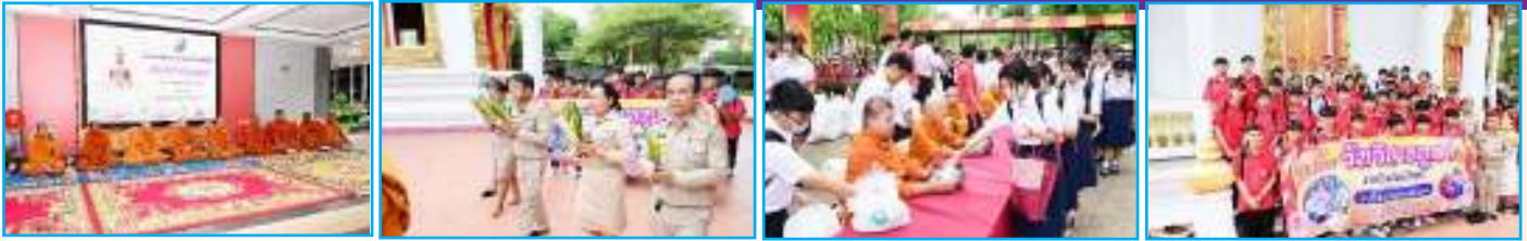
กิจกรรมทำบุญตักบาตรข้าวสาร อาหารแห้ง และเวียนเทียน เนื่องในวันวิสาขบูชา วันที่ 21 พฤษภาคม 2567

การแข่งขันตอบปัญหาเกี่ยวกับกฎหมายรัฐธรรมนูญ คดีรัฐธรรมนูญ และศาลรัฐธรรมนูญ ระดับมัธยมศึกษาตอนปลาย ในเขตพื้นที่การศึกษาภาคตะวันออก จัดโดยสำนักงานศาลรัฐธรรมนูญและมหาวิทยาลัยราชภัฏรำไพพรรณี ได้รับ "รางวัลชมเชย" ได้รับโล่รางวัล เกียรติบัตร