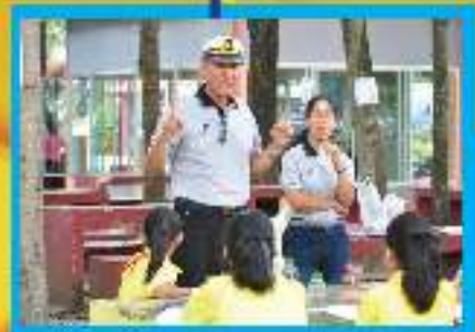
กิจกรรม One Day Camp นักเรียนชั้น ม.๒ ศึกษาภาษาที่สาม คือ ภาษาจีน และจัดทำทัศนคติชีวิตจากการเรียนรู้ภาษาจีนมาบ้าง