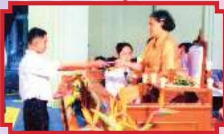
นักเรียนรางวัลพระราชทาน ระดับมัธยมศึกษาตอนต้น ปีการศึกษา ๒๕๕๐ กระทรวงศึกษาธิการ วันที่ ๑๙ สิงหาคม ๒๕๕๑