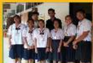
แข่งขันศิลปวัฒนธรรม ระดับมัธยมศึกษา ระดับ ๒ โรงเรียนวัดราชโอรสาราม กรุงเทพฯ ปี ๒๕๖๑ ชนะเลิศ วิชาภาษาไทย ระดับ ม.๒