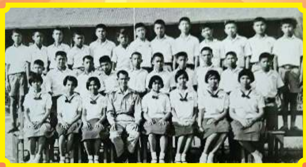
รุ่นที่ ๔๕/๒๕๐๔ ชื่อรุ่น แกลง ๐๙