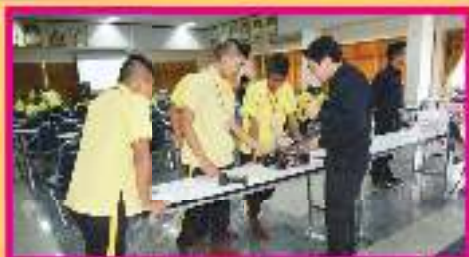
กิจกรรมโครงงาน การพัฒนาหุ่นยนต์อัตโนมัติ จากตัวโครงงานโครงงานโครงไมโครซอฟท์