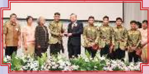
รางวัลระดับดี โครงการเยาวชนสร้างสรรค์นวัตกรรมท้องถิ่น ประจำปี ๒๕๕๙ ของสถาบันพระปกเกล้า ทีม Conserve Tea from Klaeng ชื่อโครงการ อนุรักษ์ภูมิปัญญาชาใบขลู่ ต่อยอดความรู้สู่ชุมชน