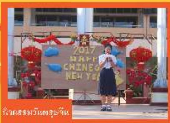
วิชาผสมวัฒนธรรมจีน