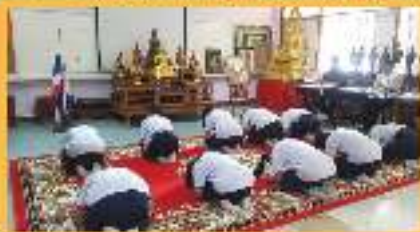
การแสดงนาฏศิลป์ สาระศิลปะศึกษาศาสตร์ ประจำปี ๖๓