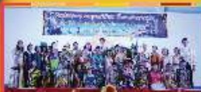
แสดงเวที วันสุนทรภู่