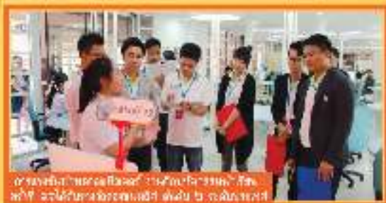
กิจกรรมงานวันเทคโนโลยี ประจำปี ๒๕๖๑ งานวันเทคโนโลยี ประจำปี ๒๕๖๑ IT DAY