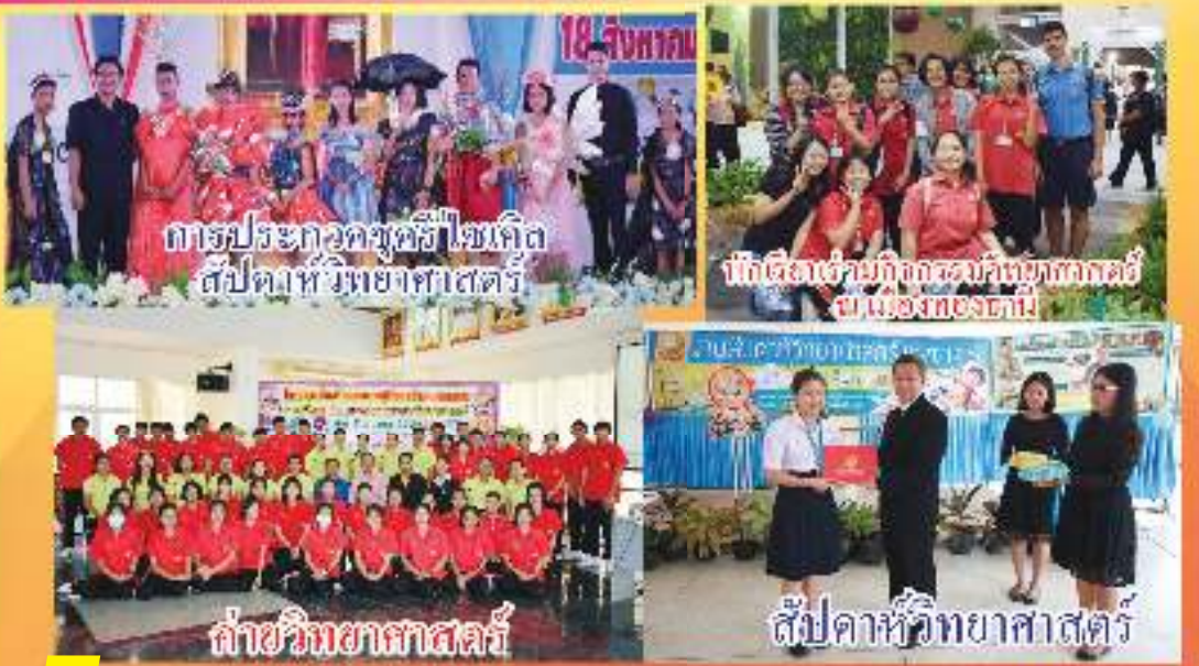
การประกวดโครงงานวิทยาศาสตร์ ระดับมหาวิทยาลัย