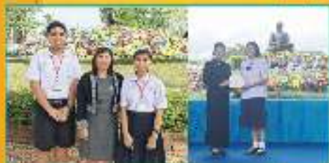
กิจกรรมวันสุนทรภู่ วิชาภาษาไทย ม.๒