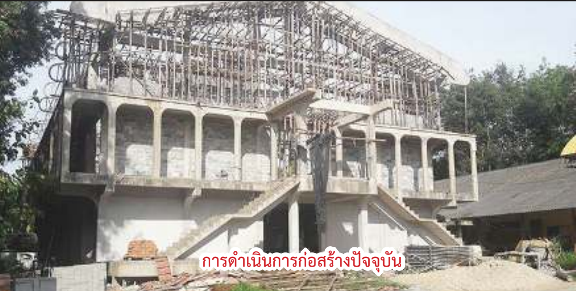
การดำเนินการก่อสร้างปัจจุบัน