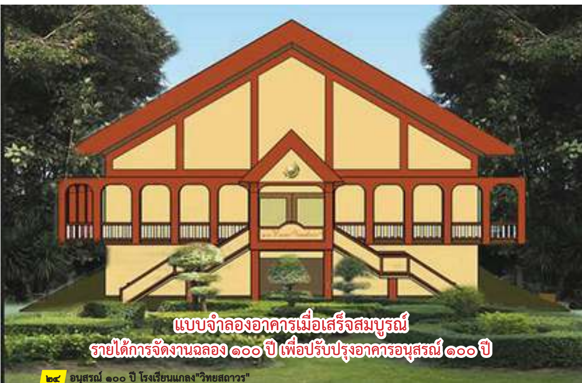
แบบจำลองอาคารเมื่อเสร็จสมบูรณ์ รายได้การจัดงานฉลอง ๑๐๐ ปี เพื่อปรับปรุงอาคารอนุสรณ์ ๑๐๐ ปี