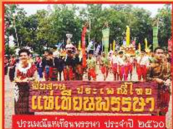
ประเพณีแห่เทียนพรรษา ประจำปี ๒๕๖๐