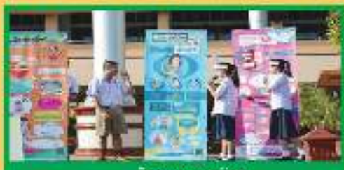
กิจกรรม งานโครงงาน