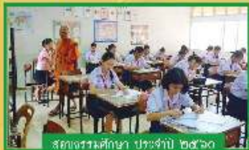
สวดธรรมศึกษา ประจำปี ๒๕๖๑