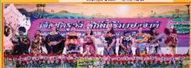
ประกวดทำละครตามหลัก ๖ ประการ ม.๒