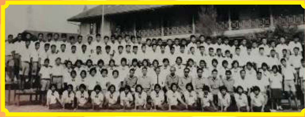
รุ่นที่ ๔๔/๒๕๐๓ ชื่อรุ่น แกลง ๐๘