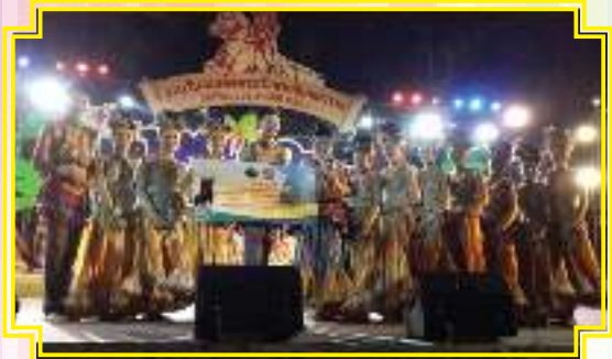
ได้รับเงินรางวัลชนะเลิศ ๑ ล้านบาท การประกวดขับร้องเพลงพระราชนิพนธ์พร้อมจินตลีลา งานวันสมเด็จพระเจ้าตากสินมหาราช ประจำปี ๒๕๕๗