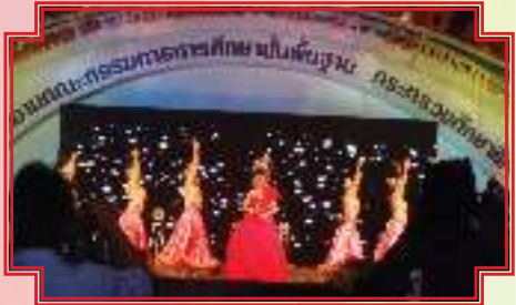
ได้รับรางวัลเหรียญทอง การประกวดวงดนตรีลูกทุ่ง ประเภท ก งานศิลปหัตถกรรมนักเรียน ระดับชาติ ครั้งที่ ๖๐ ประจำปี ๒๕๕๓