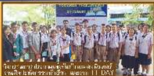
กิจกรรมงานวันเทคโนโลยี ประจำปี ๒๕๖๑ งานวันเทคโนโลยี ประจำปี ๒๕๖๑ IT DAY