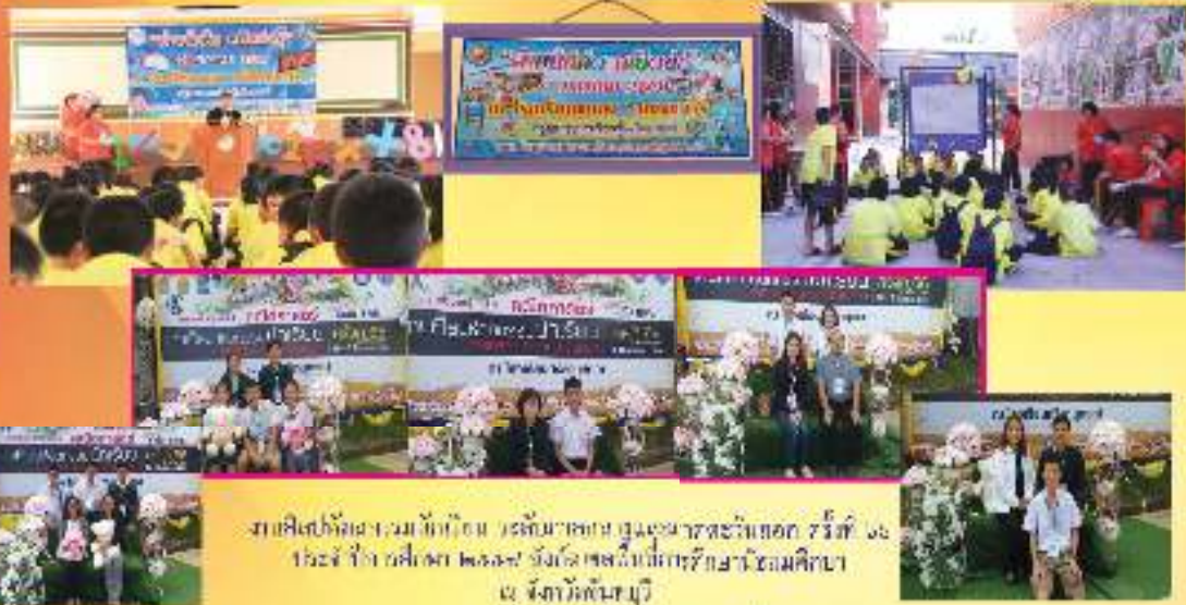
งานศิลปะที่ผลงานนักเรียน ได้รับรางวัล ชนะเลิศ ระดับชั้นมัธยมศึกษา ระดับ ๖ และ ๗ ประจำปี ๒๕๖๕ ซึ่งได้แข่งขันที่มหาวิทยาลัยเทคโนโลยีพระจอมเกล้าธนบุรี