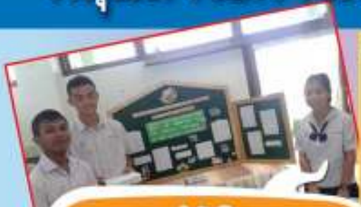
การแข่งขันโครงงาน วิทยาศาสตร์ภาคภาษาอังกฤษ