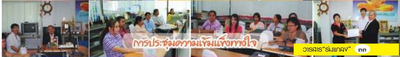
การประ: ช้มควมแ้มน้่งท้างจ้