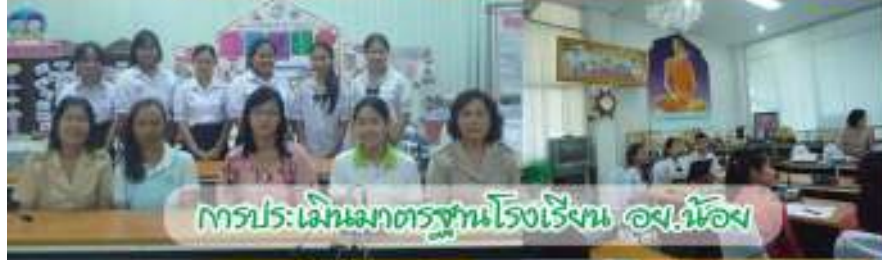
การประ: เฝ้มนมกตรฐนร้องเร้งน อง.น้อง