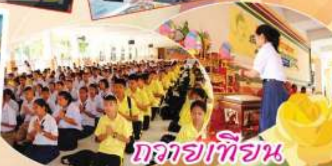
ถวายเทียน