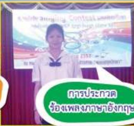
การประกวด ร้องเพลงภาษาอังกฤษ