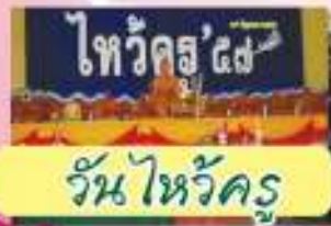
วันไหว้ครู