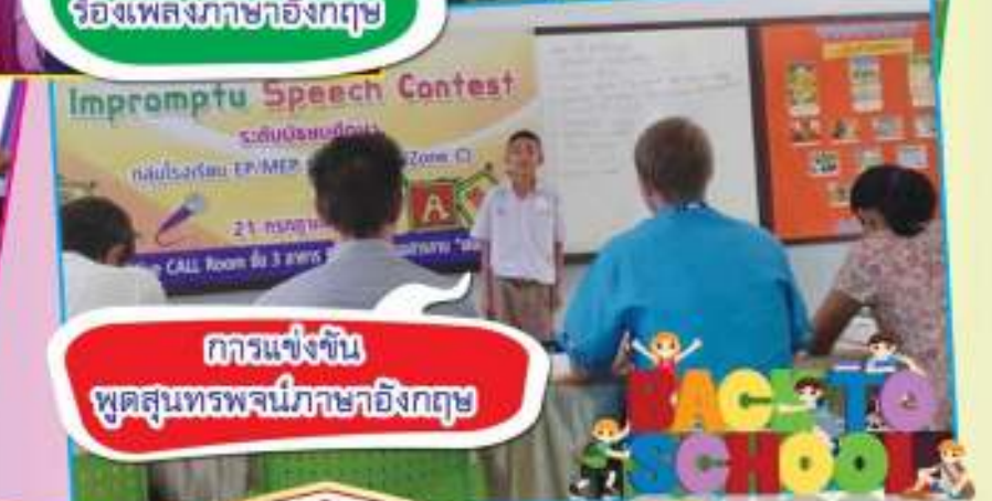
การแข่งขัน พูดสุนทรพจน์ภาษาอังกฤษ