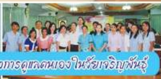
การให้ความรู้เรื่องการดูแลตนเองในวัยเจริญพันธุ์