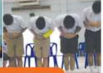
โครงการอบรมสัปดาห์ภาษาไทย