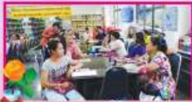
ประชุมผู้ปกครอง