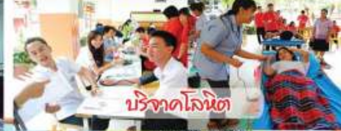
บร้จาดล้อนน้ด