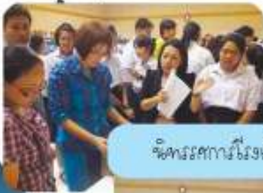
พิธีมอบรางวัลโรงเรียนสำหรับหน่วยงานราชการ