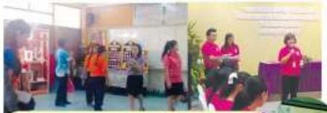
กิจกรรมเผยแพร่งานด้านวัฒนธรรมของโรงเรียน ๓๑ ตุลาคม ๒๕๖๑