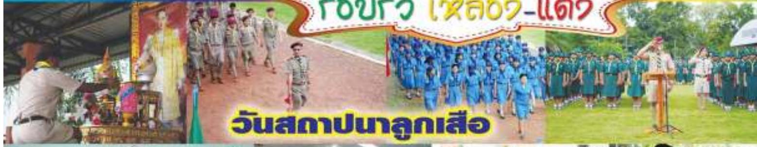
วันสถาปนาลูกเสือ