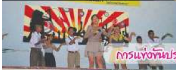
การน้่งท้บร: กวดร้องเพลงแล: แด้ต้นเชอ้ร ม.๑