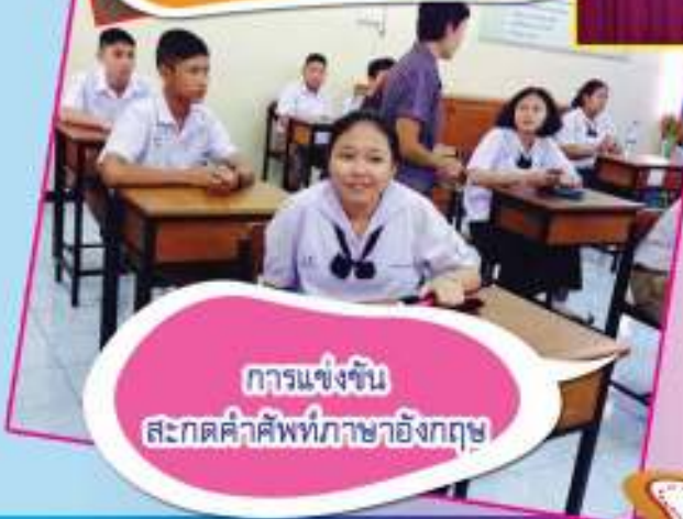
การแข่งขัน สะกตคำศัพท์ภาษาอังกฤษ