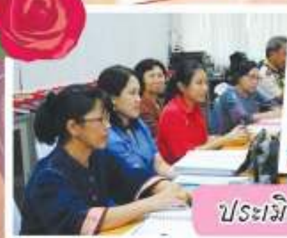
ประเมินโรงเรียนคุณธรรม