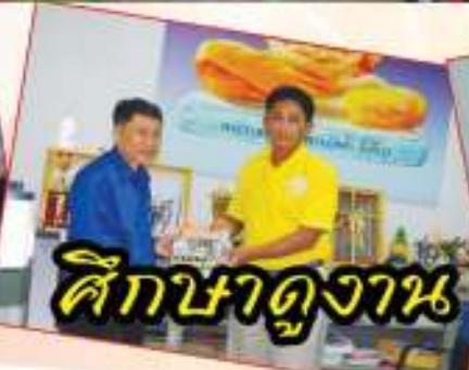
ศึกษาดูงาน