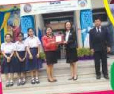
ตอบปัญหาภาษาอังกฤษระดับโรงเรียน ๓๑ ตุลาคม ๒๕๖๑