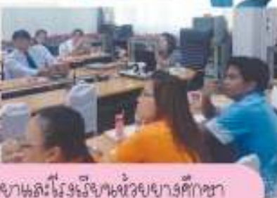
คณะกรรมการโรงเรียนสหประชาชาติและโรงเรียนช่วยขยายการศึกษา ศึกษาฐานะโรงเรียนสำหรับหน่วยงานราชการ