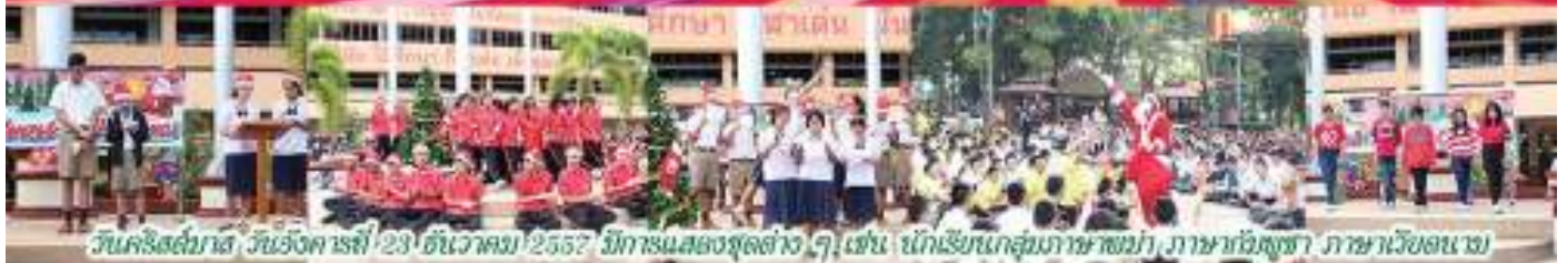
วันคริสต์มาส วันอังคารที่ 23 ธันวาคม 2557 มีการแสดงชุดต่าง ๆ เช่น นักเรียนกลุ่มภาษาพม่า ภาษาอังกฤษ ภาษาเวียดนาม การเต้น Cover Dance และการแสดงของครูชาวต่างชาติ