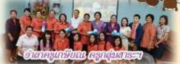
อาสาครูเกษียณ ครูกลุ่มสาระฯ