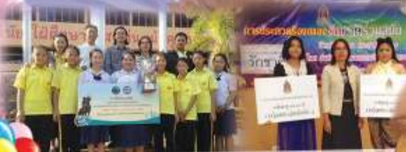
รางวัลชนะเลิศ

การประกวดร้องเพลงพระราชนิพนธ์พร้อมพินัยลีลา ในสนามวันสมเด็จพระเจ้าตากสินมหาราช จัตุรัสวัดระฆัง ประจักษ์ปี 2557 ขององค์การบริหารส่วนจังหวัดระยอง ได้รับรางวัลชนะเลิศ พร้อมเงินรางวัลรวมทั้งสิ้น 1 ล้านบาท