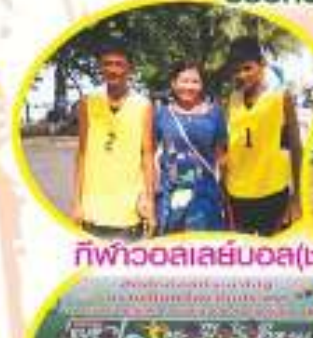
กีฬาบาสเลย์บอล(ชายตทท) ยูไร้กัก