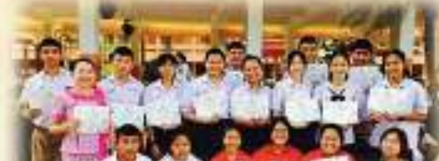
กิจกรรมแข่งขันร้องเพลง (วงดนตรี) และประกวดร้องเพลง ส.ส.ม.พ.ศ. กลุ่มสาระการเรียนรู้ ภาษาไทย ภาษาเวียดนาม เป็นตัวแทน ไปแข่งขันในระดับจังหวัด ณ วันที่ 4 ตุลาคม ได้รางวัลชนะเลิศ Impromptu Speech และโครงงาน MIP-Skill