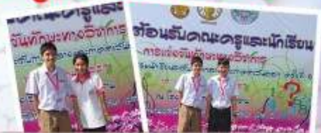
การแข่งขันทักษะวิชาการ อัจฉริยภาพทางคณิตศาสตร์ ระดับชั้น.ต้น แลสม.ปลาย ตามศิลปศึกษากรมศึกษาธิการระดับภาคกลางและภาคตะวันออก ครั้งที่ 64 วันที่ 17-19 ธันวาคม 2557 ณ โรงเรียนวัดเขมาภิรตาราม