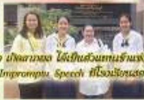
งานศิลปหัตถกรรมระดับจังหวัด ครั้งที่ 68 จังหวัดบุรีรัมย์ นักเรียนห้องเรียน 9 เข้าร่วมการแข่งขัน MIP-Skill และนักเรียนห้องเรียน 9 เข้าร่วมการแข่งขัน Impromptu Speech ที่โรงเรียนเสด็จวิทยาคม