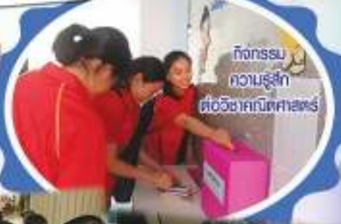
กิจกรรม ความรู้รัก ต่อวิชาคณิตศาสตร์