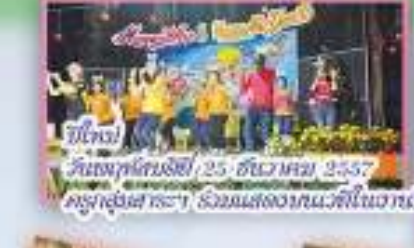
ปีใหม่ วันพฤหัสบดีที่ 25 ธันวาคม 2557 ครูผู้สอน คณะฯ ร่วมแสดงบนเวทีในวันปีใหม่