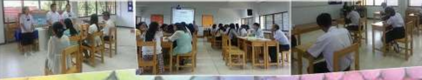
ประชุมครูคณิตศาสตร์ ตามศิลปศึกษากรมศึกษาธิการ ครั้งที่ 64 - ระดับวิทยาเขต ระยอง 2