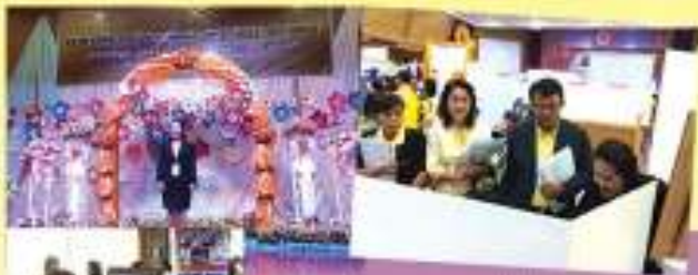
ฐานโครงงานโครงงานวิทยาศาสตร์ระดับมัธยมศึกษา

การประกวดโครงงานวิทยาศาสตร์ที่มีนักเรียน ไปแข่งขันที่โรงเรียนเตรียมอุดม วิทยาลัยวิทยาศาสตร์วชิรฯ พร้อมนักเรียน ครูและผู้บริหาร คณะวิทยาศาสตร์