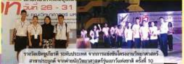
รางวัลเชิดชูเกียรติ ระดับประเทศ จากการแข่งขันโครงงานวิทยาศาสตร์ สาขาประดิษฐ์ จากค่ายมัธยมศึกษาสู่ผู้แทนแห่งชาติ ครั้งที่ 10 ณ ม.ขอนแก่น วันที่ 28-31 พ.ค. 2557

จากกิจกรรมแข่งขัน science award 2557 ระดับมัธยมศึกษาและภาคตะวันออกเฉียงเหนือ ระดับมัธยมศึกษาตอนปลาย กลุ่มสาระการเรียนรู้วิทยาศาสตร์ จัดโดย วิทยาลัยเทคโนโลยีและการจัดการอบรม ในวันที่ 25 พ.ค. 57 ณ โรงเรียนอัสสัมชัญวิทยาลัย กรุงเทพมหานคร ได้ไปแข่งขันระดับประเทศ