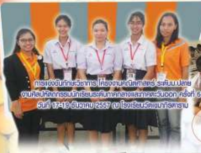
การแข่งขันทักษะวิชาการ โรงเรียนคณิตศาสตร์ ระดับ.ม.ปลาย ตามศิลปศึกษากรมศึกษาธิการระดับภาคกลางและภาคตะวันออก ครั้งที่ 64 วันที่ 17-19 ธันวาคม 2557 ณ โรงเรียนวัดเขมาภิรตาราม