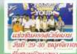
แข่งขันประกวดร้องเพลง วันจันทร์ 30 พฤศจิกายน 2557 (มีภาพนักเรียนร่วม)