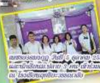
แข่งขันประกวดร้องเพลง วันจันทร์ 5 ตุลาคม 2557 มีนักเรียนชั้น 9 คน และนักเรียนชั้น มัธยมศึกษา 9 คน เข้าร่วมแข่งขันภาษา อังกฤษและภาษาเวียดนาม ครบทั้ง 9 คน โรงเรียนคุณจึงมีชื่อเสียง