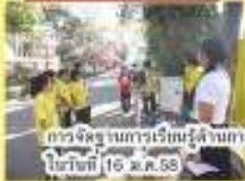
การจัดฐานการเรียนรู้ด้านวิทยาศาสตร์จากนักเรียนและนิสิตอาชีวศึกษา ในวันที่ 16 พ.ค. 58

โครงการ ร.ร. ร่วมใจร่วมมือใส่ใจพัฒนา แม่น้ำประเทสในชุมชนคลองวังน้อย ได้รับทุนสนับสนุนจากโครงการ ปลูกใจรักโลกครั้งที่ 3