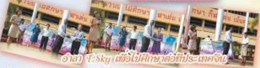
อาสา 7:30ky เพื่อไปศึกษาต่อที่ประเทศจีน