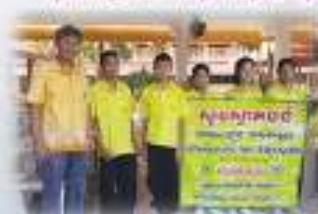
กิจกรรมรณรงค์ 70 พรรษาของโรงเรียน สืบสานศิลปวัฒนธรรมไทย เช่น ภาษา อังกฤษ ภาษาพม่า ภาษาเวียดนาม ภาษาจีน และภาษาเวียดนาม