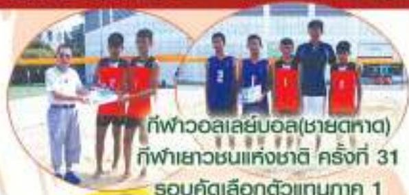
กีฬาบาสเลย์บอล(ชายตทท) กีฬาเยาวชนแห่งชาติ ครั้งที่ 31 รอบคัดเลือกตัวแทนภาค 1