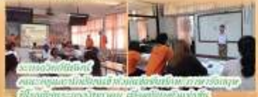
กิจกรรมวันคริสต์มาส และกิจกรรมวันปีใหม่ ที่โรงเรียนและห้องเรียน ภาษาอังกฤษ ภาษาเวียดนาม และภาษาจีน