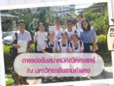
การแข่งขันสมาคมคณิตศาสตร์ ณ มหาวิทยาลัยรามคำแหง