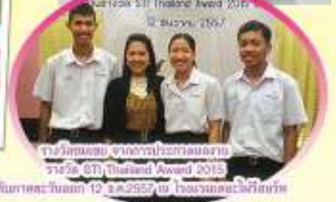
รับเกียรติรางวัลชนะเลิศ จากการแข่งขันโครงงาน รางวัล BTI Thailand Award 2015 ระดับมัธยมศึกษา วันที่ 12 มิ.ย. 2557