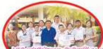
MIP ช่วงต้นปีการศึกษา วันจันทร์ที่ 21 กรกฎาคม 2557 นักเรียนห้องเรียน MIP เข้าร่วมการแข่งขันศิลปะวิชาการ ที่จังหวัดระยองและกรุงเทพฯ เช่น โครงงานเขียนภาพสามมิติ สื่องเพลง Apelling-It- Impromptu Speech เป็นต้น