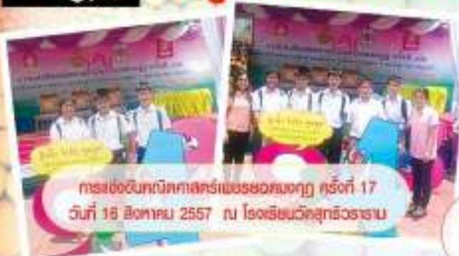
การแข่งขันคณิตศาสตร์เพชรยอดมงกุฎ ครั้งที่ 17 วันที่ 18 สิงหาคม 2557 ณ โรงเรียนวัดสุทัศน์วราราม