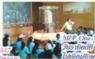
MIP One-Day Trip วันอาทิตย์ที่ 30 พฤศจิกายน 2557 นักเรียนห้องเรียน MIP ไปทัศนศึกษา ที่พิพิธภัณฑ์ธรรมชาติวิทยาแห่ง สห. วิจัยและวิจัยวิทยาศาสตร์ธรรมชาติและพิพิธภัณฑ์ และศาลาบ้านไร่