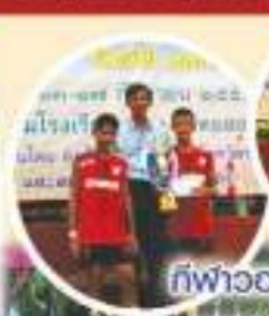
กีฬาบาสเลย์บอล(ชายตทท) มหกรรมกีฬาระยองเกมส์