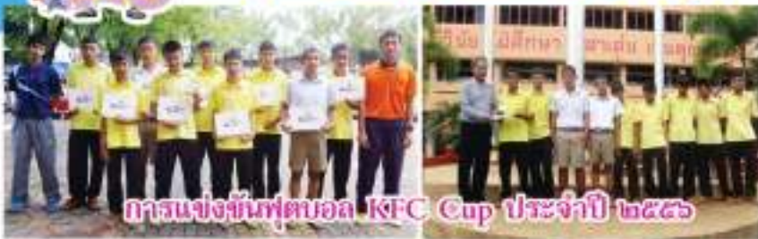
การแข่งขันฟุตบอล KFC Cup ประจำปี ๒๕๕๖