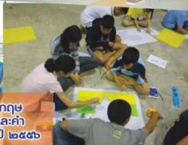
การแข่งขัน Story Telling เล่านิทานภาษาอังกฤษ กิจกรรมค่ายอาเซียน กิจกรรมภาษาอังกฤษวันละคำ กิจกรรมอาเซียน ร่วมชบวนพาเหรดกีฬาปี ประจำปี ๒๕๕๖