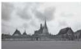
เหรียญ ๑ บาท

รูปด้านหลังคือ วัดพระศรีรัตนศาสดาราม(วัดพระแก้ว)