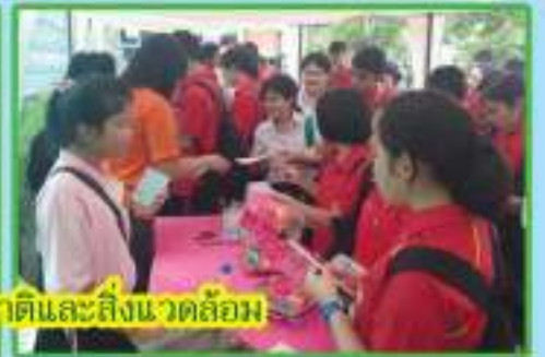
ร่วมกิจกรรมกับกรมทรัพยากรธรณี เกาะหวงทรัพยากรธรรมชาติและสิ่งแวดล้อม