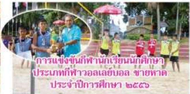
การแข่งขันกีฬานักเรียนนักศึกษา ประเภทกีฬาบอลเลย์บอล ชายหาด ประจำปีการศึกษา ๒๕๕๖