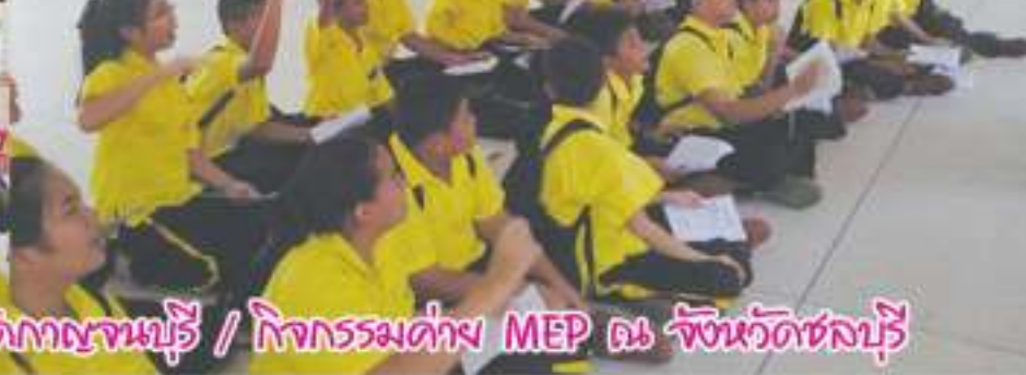
กิจกรรมค่าย MEP ณ จังหวัดกาญจนบุรี / กิจกรรมค่าย MEP ณ จังหวัดชลบุรี