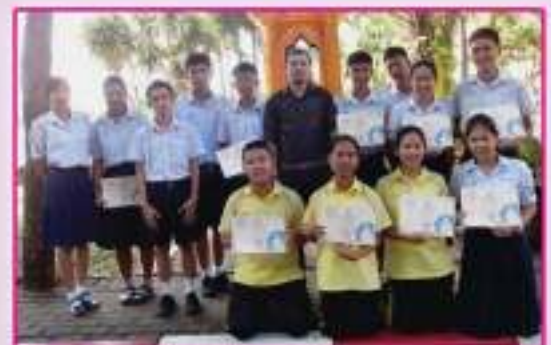
การอบรมเรื่องการสอนเชิงกลยุทธ์เพื่อพัฒนาสู่สัมฤทธิ์ผล ของการทดสอบผลสัมฤทธิ์ทางการเรียนระดับชาติ (O-NET) ในวิชาสังคมศึกษา