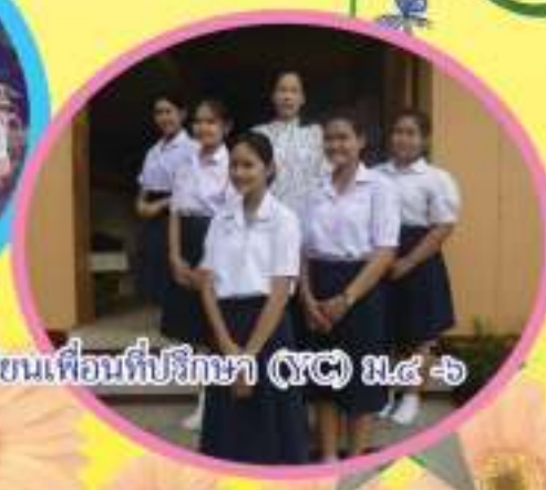
นักเรียนเพื่อนที่ปรึกษา (YC) ม.๔ - ๖