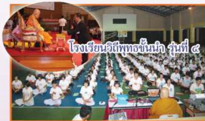
โรงเรียนวิถิพุทธชั้นนำ รุ่นที่ ๔