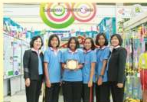
รับโล่รางวัลชมรมคุ้มครองผู้บริโภค โรงเรียนแก่ง"วิทยสถานาร" จังหวัดระยอง เป็นชมรมที่ทำคุณประโยชน์ ด้านการคุ้มครองผู้บริโภค และเป็นตัวอย่างที่ดีของ การจัดกิจกรรมคุ้มครองสิทธิผู้บริโภค เป็นกิจกรรมพัฒนาผู้เรียน ที่มีผลงาน "ดีเด่น" วันที่ ๓๐ เมษายน ๒๕๕๖