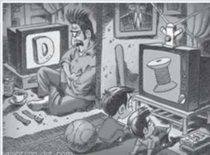
ภาพที่ ๓ (๗ พยางค์)