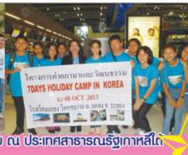
กิจกรรมค่ายภาษาและวัฒนธรรม ณ ประเทศสาธารณรัฐเกาหลีใต้