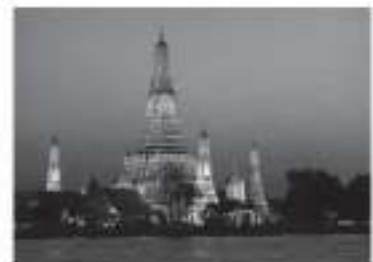
เหรียญ ๑๐ บาท

รูปด้านหลังคือ วัดอรุณราชวราราม(วัดแจ้ง) เป็นวัดโบราณ สร้างขึ้นในสมัยอยุธยา จัดอยู่ในประเภท พระอารามหลวงชั้นเอกพิเศษ ตั้งอยู่ในกรุงเทพมหานคร