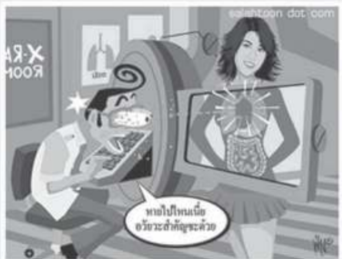
ภาพที่ ๒ (๒ พยางค์)