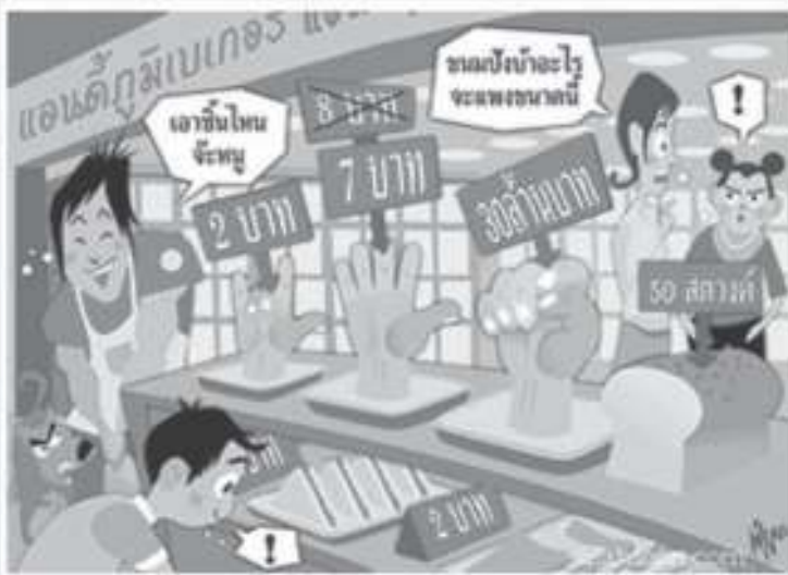
ภาพที่ ๑ (๒ พยางค์)