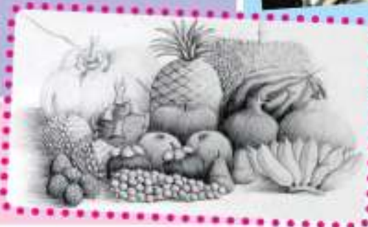
รางวัลเหรียญทองชนะเลิศ วาดภาพรูปผลไม้รวม เด็กหญิงกัญญา แวววัปศิริ