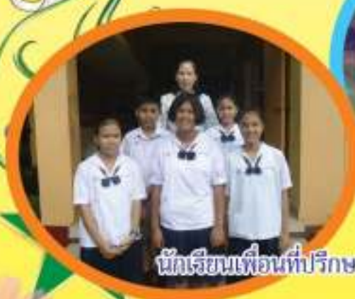
นักเรียนเพื่อนที่ปรึกษา (YC) ม.๑ - ๓