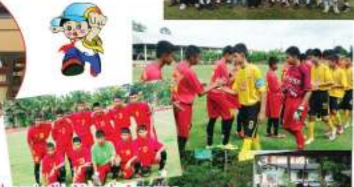
แข่งฟุตบอล SCG Chemicals Youth League รอบคัดเลือก ระหว่าง โรงเรียนแก่ง "วิทย์สกลนคร" และโรงเรียนชำนาญสามัคคีวิทยา ๒๓ พฤษภาคม ๒๕๕๖