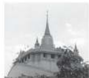
เหรียญ ๒ บาท

รูปด้านหลังคือ วัดสระเกศราชวรมหาวิหาร(ภูเขาทอง) ตั้งอยู่ริมคลองมหามาศ เขตป้อมปราบศัตรูพ่าย กรุงเทพมหานคร เป็นพระอารามหลวงชั้นโท ชนิดราชวรมหาวิหาร