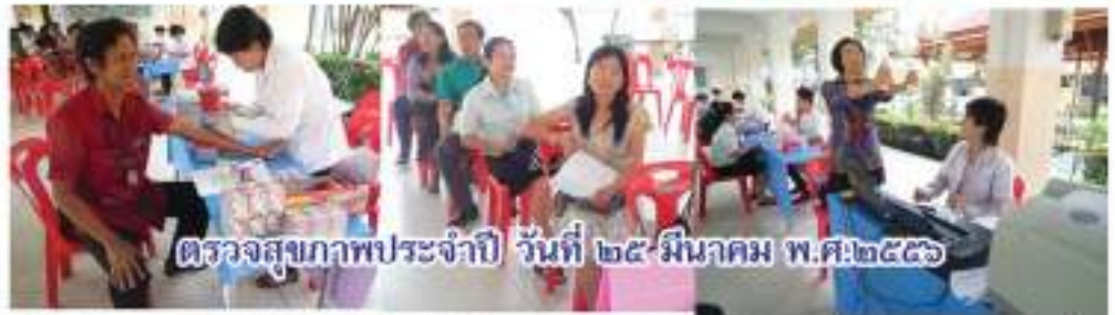
ตรวจสุขภาพประจำปี วันที่ ๒๕ มีนาคม พ.ศ.๒๕๕๖