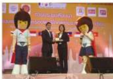
รับโล่รางวัลชมรมคุ้มครองผู้บริโภคดีเด่นยอดเยี่ยม ปีการศึกษา ๒๕๕๖

ในงานชุมนุมเยาวชนคุ้มครองผู้บริโภค แห่งประเทศไทยสู่อาเซียน ๑๖ สิงหาคม ๒๕๕๖