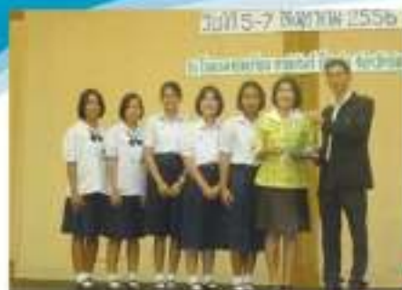
รับโล่รางวัลโครงการ อย.น้อย เพื่อแก้ไขปัญหายุทธศาสตร์ในโรงเรียน ดีเด่น