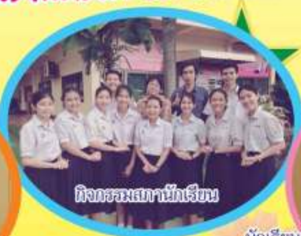
กิจกรรมสถานักเรียน