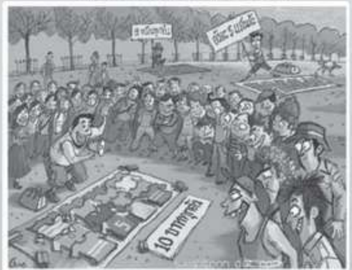
ภาพที่ ๔ (๒ พยางค์)