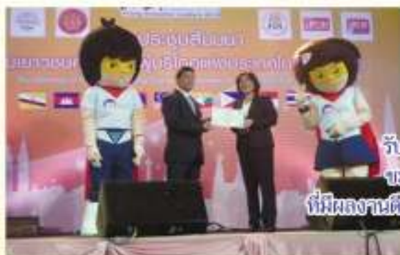
รับมอบวุฒิบัตร ครูที่ปรึกษา ชมรมคุ้มครองผู้บริโภค ที่มีผลงานดีเด่น ประจำปีการศึกษา ๒๕๕๖

ในงานชุมนุมเยาวชนคุ้มครองผู้บริโภค แห่งประเทศไทยสู่อาเซียน ๑๖ สิงหาคม ๒๕๕๖