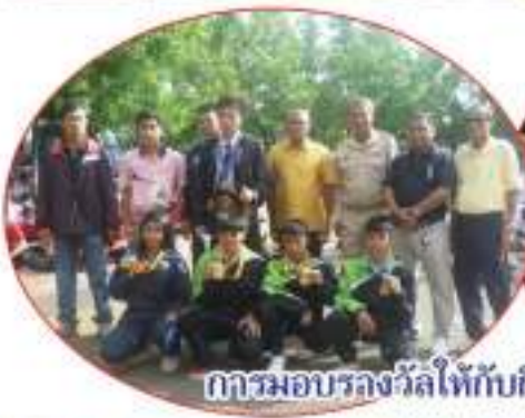
การมอบรางวัลให้กับกีฬามวย ๓ มิถุนายน ๕๖