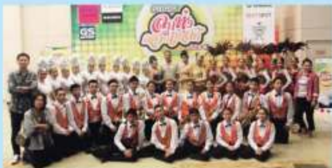
การประกวด วงดนตรีเยาวชนยามาฮ่า ลูกทุ่งคอนเทสต์ ครั้งที่ ๑๑ ณ ห้างแพชั่นไฮซ์แลนด์ รางวัลพิเศษของ อันดับ ๑๐ จาก ๓๑ ทีม เมื่อวันที่ ๑๗ ตุลาคม ๒๕๕๖