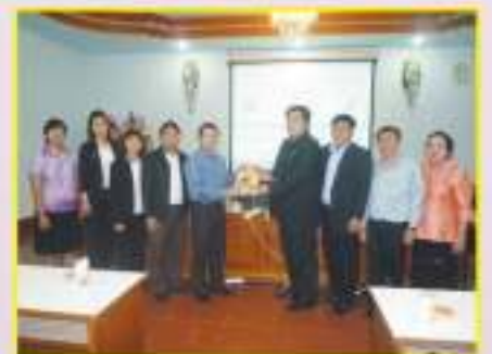
ต้อนรับคณะศึกษาดูงานโรงเรียนจุฬาภรณราชวิทยาลัย จังหวัดปทุมธานี เข้าศึกษาการดำเนินงานองค์การบริหารส่วนนักเรียน (สภานักเรียน) วันที่ ๑ สิงหาคม พ.ศ. ๒๕๕๖