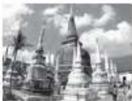
เหรียญ ๒๕ สตางค์