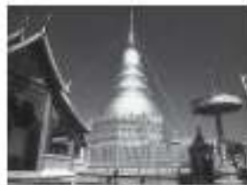
เหรียญ ๕๐ สตางค์

รูปด้านหลังคือวัดพระธาตุทองสุเทพราชวรวิหาร