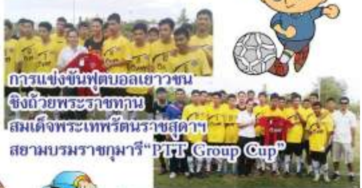
การแข่งขันฟุตบอลเยาวชน ซึ่งด้วยพระราชทาน สมเด็จพระเทพรัตนราชสุดาฯ สยามบรมราชกุมารี "PTI Group Cup"