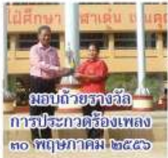
มอบด้วยรางวัล การประกวดร้องเพลง ๓๐ พฤษภาคม ๒๕๕๖